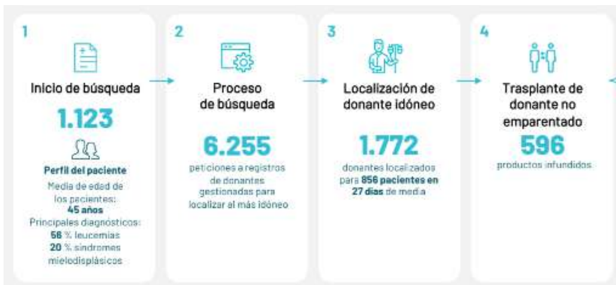
Informe REDMO 2022.

El pasado 2022, se realizaron en España 596 trasplantes de médula ósea de donantes anónimos no emparentados. Sólo el 22 % procedían de donantes españoles, el resto venían de fuera de España.